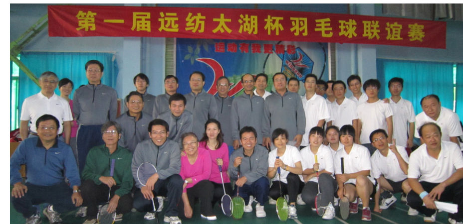
(第一届远纺太湖杯羽毛球联谊赛)

为切实关心员工身体健康, 让每位员工对自己的身体状况有个全面的了解, 同时把关心爱护员工的工作落到实处, 公司于 2010 年 11 月底组织各部门员工分批进行体检。此次健康体检包括心电图、胸透、血液三个大项。在各部门的组织下, 体检在宿舍区有条不紊地进行, 员工们逐个排队静候, 医生们仔细检查。